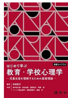
学校の先生向けの教育心理学の教科書